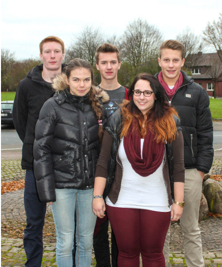
Zweite Generation – Ausgebildet 2011/12