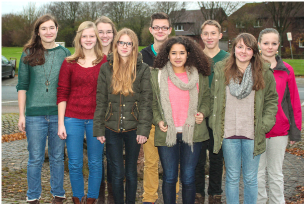
Dritte Generation – Ausgebildet 2013/14